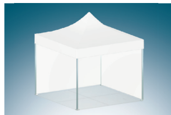
Standgröße 3,0 x 3,0 Meter

Kombinieren Sie Ihr Zelt oder nutzen Sie unseren Beratungsservice: +49 6433 946668 0 sowie per E-Mail an interesse@peptent.de